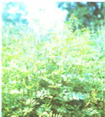
495. Козлятник лікарський